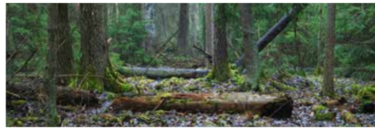
Skogsgolvet under träden