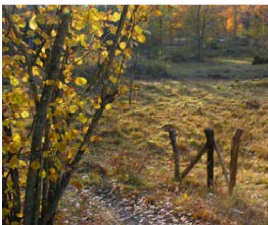
Höst i hagarna