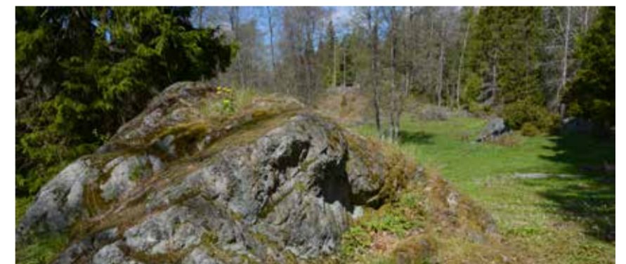
Skogen möter det öppna landskapet