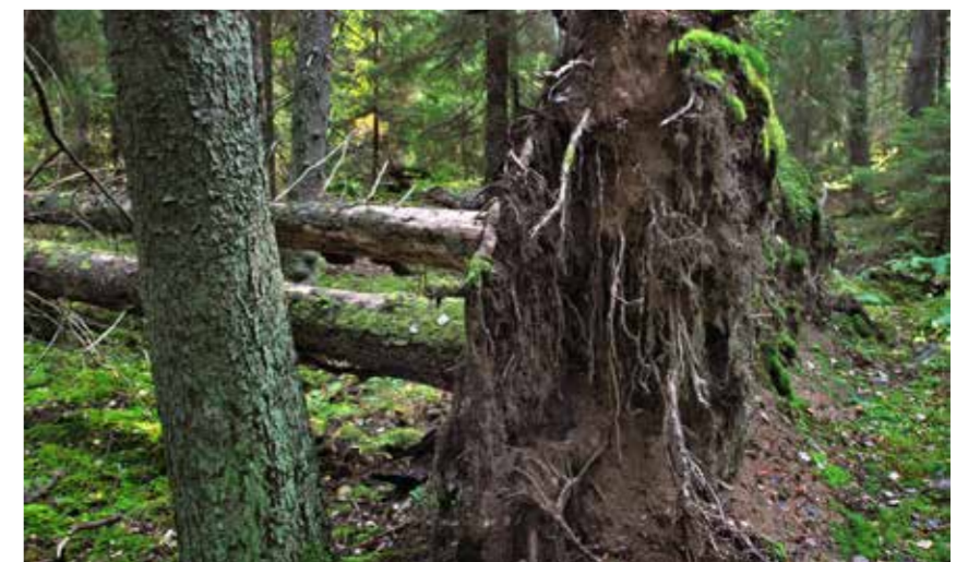
Den gamla Gladöskogen