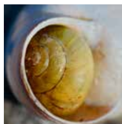
Snäcka i snäcka