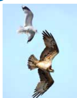
Fiskmåsar och fiskguse