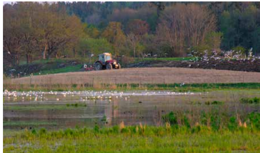
Vårbruk i Balingsta

Är du fiskesugen går det att hyra båt, både här och vid Ebbadal. På land