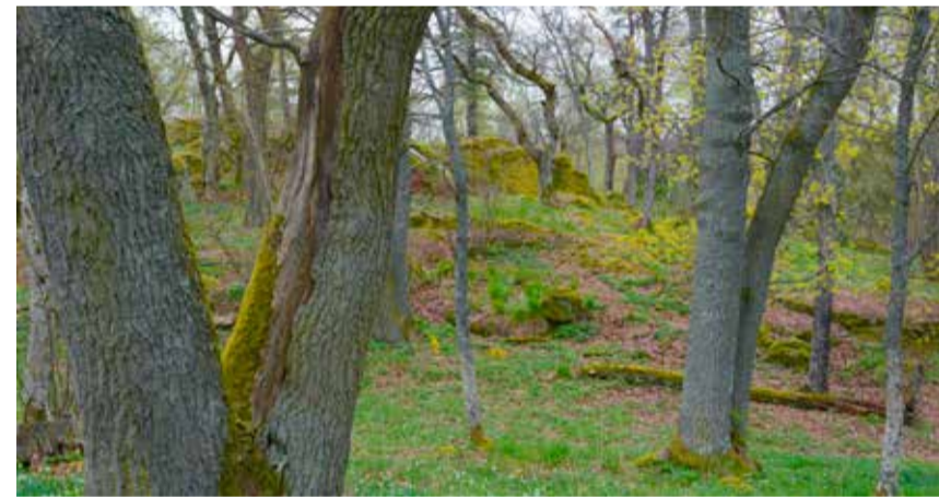
Ädellövskog vid Ågestaberget

Vilda barrskogar hittar du främst mellan Balingsnäs och genom hela reservatet österut till Ågestasjön. Här är det gran och tall som dominerar även om skogen innehåller så mycket mer. Asp, björk, klibbal, rönn och ek är några av de lövträd som varierar den gamla barrskogen.