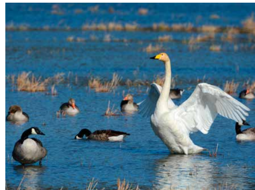
Värfåglar i Ågestasjön

Detta våtmarksrike är rikt på upplevelser, förutom fåglar så finns också andra djur som dykarbaggar, grodor, salamandrar, trollsländor eller fladdermöss. Fladdermössen är fulländade mästervägar som fascinerar när de jagar nattens rika insektsliv. Spektakulära groddjur kan ses och höras då de leker om våren i de grunda vattensamlingarna. Kraftfulla dykarskalbaggar och vackra trollsländor engagerar både gammal och ung när häven kommer fram. Som bonus levererar våtmarkerna ekosystemtjänster när vattnet renas och syresätts i det fortsatta kretsloppet mot Östersjön. Besök Orlångens våtmarksrike med upplevelser och kunskap att ta del av.