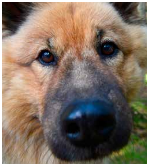
Nosgos med hund