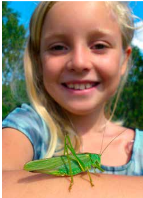
Spänning med värtbitare