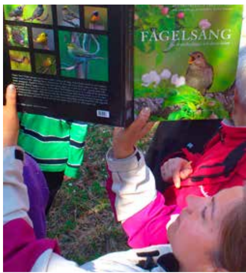
Nyfiken på fåglar