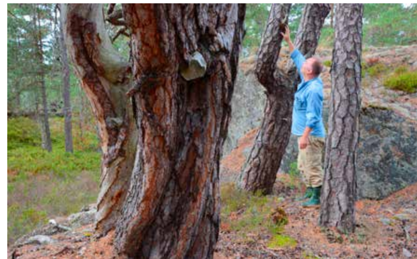
Uråldrig tallskog på Krävleberget

Välkommen till ett reservat i Huddinges natur med upplevelser året runt!