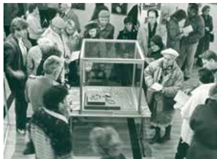
Vårbyskatten finns att se på Historiska museet.