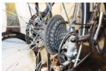
Kedjan ska oljas in men gör man inte rent samlas smuts och oljan mister sin funktion.

skyddande olja. Det sliter på kedjan som töjs ut och slits.