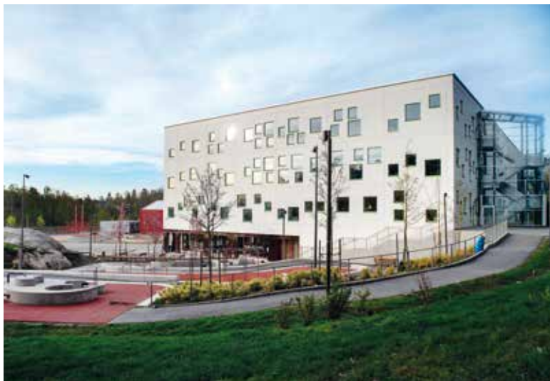
Med 558 röster är Glömstaskolan vinnare av Huddinges byggnadspris 2018.