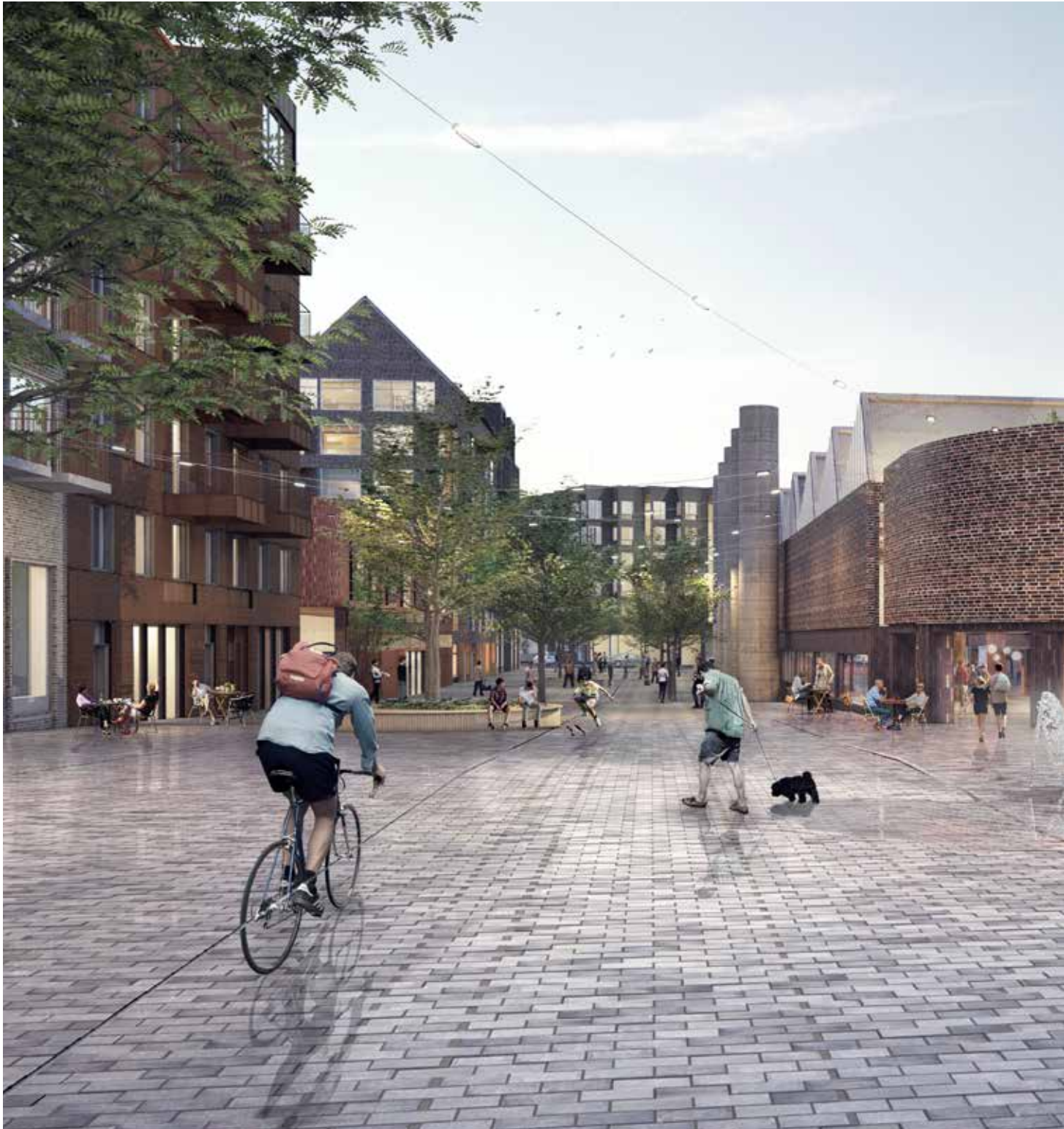
Den cigarrformade tegelbyggnaden bakom bryggeriet ska bevaras och här planeras för, bland annat, ett bibliotek.