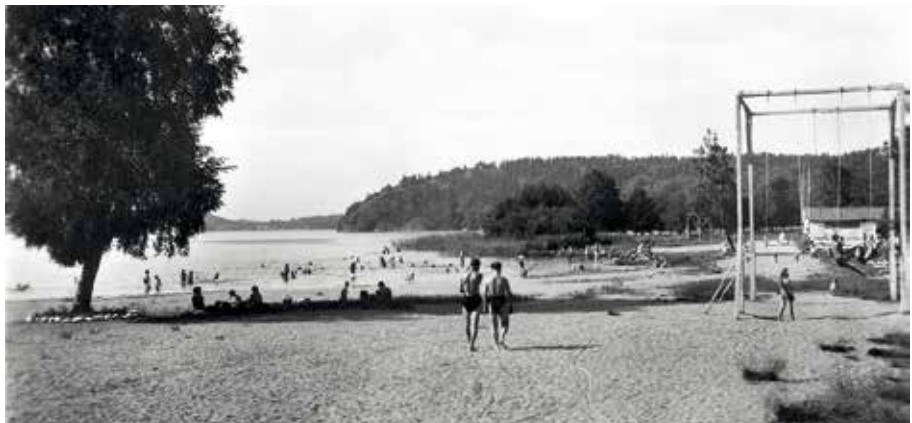
Det var inte ovanligt med 3 000 till 4 000 badgäster i Vårbybadet på 1920-talet.