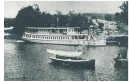
Under 1920-talet kom badgäster långväga ifrån till Vårbybadet.

som drev vilohem för kvinnliga tbc-sjuka patienter i huvudbyggnaden mellan 1938 och 1968. Huvudbyggnaden ödelades i en brand i maj 1975.