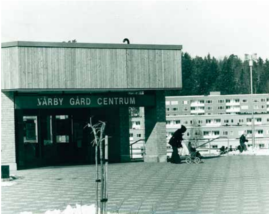
Vårby centrum stod klart 1973.