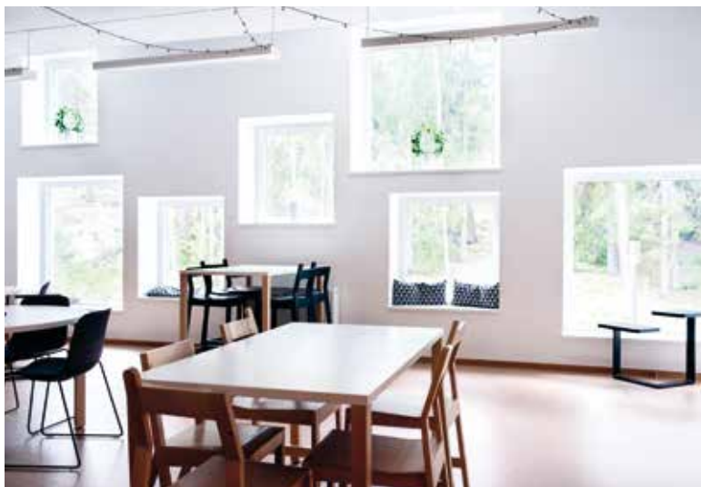
Så här ser ett av undervisningsrummen ut.