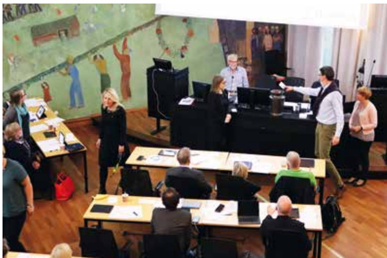
En ögonblicksbild från fullmäktigesalen under en sluten omröstning vid första sammanträdet efter kommunalvalet.

Partierna är också överens om att låta privata initiativ ta mer plats och om att arbeta för lägre kommunalskatt.