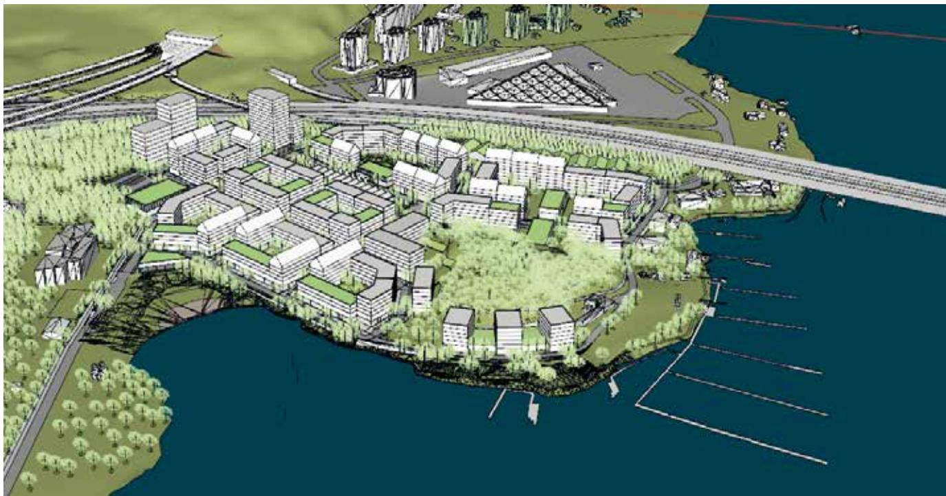
Vårby udde ska rymma bland annat bostäder, förskola, skola, äldreboende och idrottshall. Inflyttning planeras till 2024/2025.

Den cigarrformade tegelbyggnaden bakom bryggeriet ska bevaras för framtiden och tanken är att den ska omvandlas till lokaler och bibliotek.