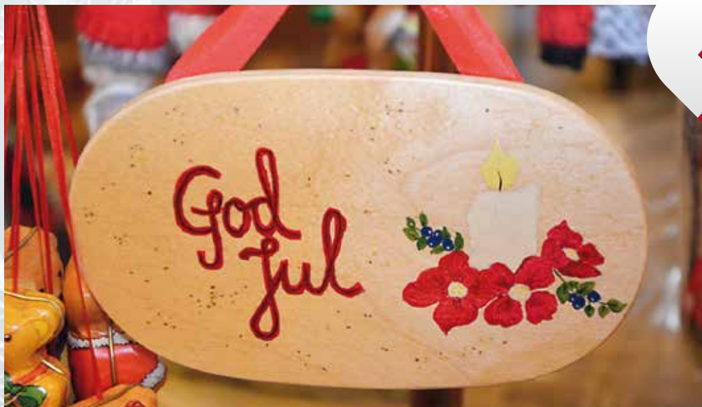
Det visas en hel del stämmingsfull hantverk på årets julmarknader.

JULMARKNAD , Stortorpsparken kl. 11–15, Tjäderstigen 16, Trångsund. Traditionell julmarknad med försäljning av fika, korv, glögg och pepparkakor. Marknadsstånd med försäljning av diverse hemslöjdat och hembakat med mera. Lotteri, chokladhjul, ponnyridning. Dessutom har tomten lovat komma på besök. Arrangör: Föreningen Stortorpsparken. Mer info: stortorps- parken.se.