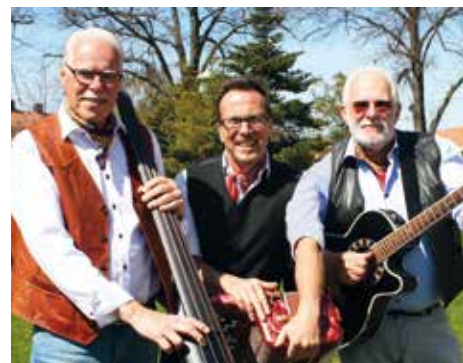
Populära Gott och blandat spelar sköna låtar hos Folkes 13 april.

ARBINA OCH MINNES-TRÄDET , Tonsalen kl. 14, Kyrkogårdsvägen 2. Med inspiration från nordisk mytologi berättar Teater Sláva en nyskriven saga med en egensinnig hjältinga. Prinsessan Arbina lever i en uråldrig framtid efter den stora ekologiska katastrofen. Genom drömmar får hon tecken på att det finns liv någonstans i ödemarken. Rustad med magiska trollformler beger hon sig ut på ett spännande äventyr fyllt av faror och skönhet för att hitta vägen till en ny värld. Pris: 60 kr. Biljetter: tickster.com, info@teaterslava.org eller 08-551 705 17. Mer info: teaterslava.org .