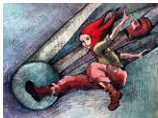
Nyskriven saga i Tonsalen av Teater Sláva.