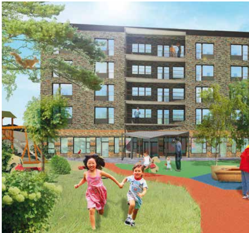
Med kombinationen äldreboende och förskola i samma byggnad behöver mindre mark