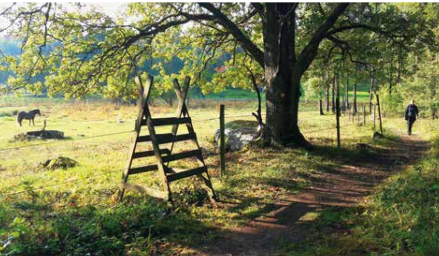
Huddingeleden går bland annat genom Fullersta hagar.