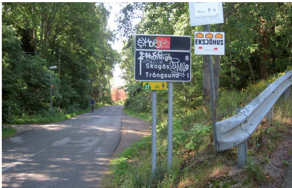
Många cykelvägvisningsskyltar är klottrade och oläsliga

I Huddinge finns dessutom ett turcykelnät med 27 rutter som beskriver rekommenderade cykelturer med betoning på natur- och kulturupplevelser. Dessa vänder sig dock inte till pendlingscyklister och fungerar inte utan turcykelkarta.